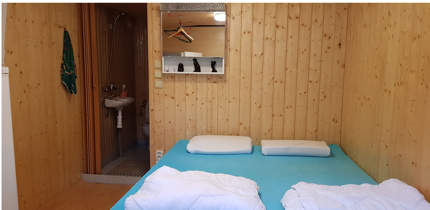
Ložnice ve vedlejší budově pro 2 osoby. Lůžko se dá zmenšit pro jednu osobu na více volného prostoru.