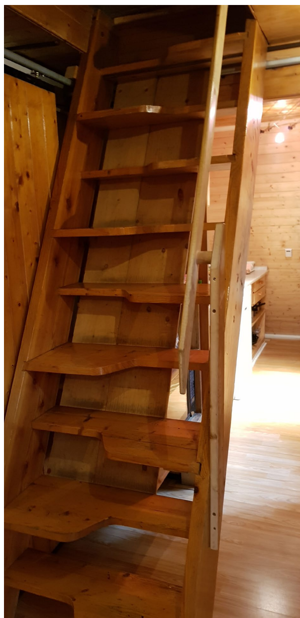
Mlynářské schody do 1. patra