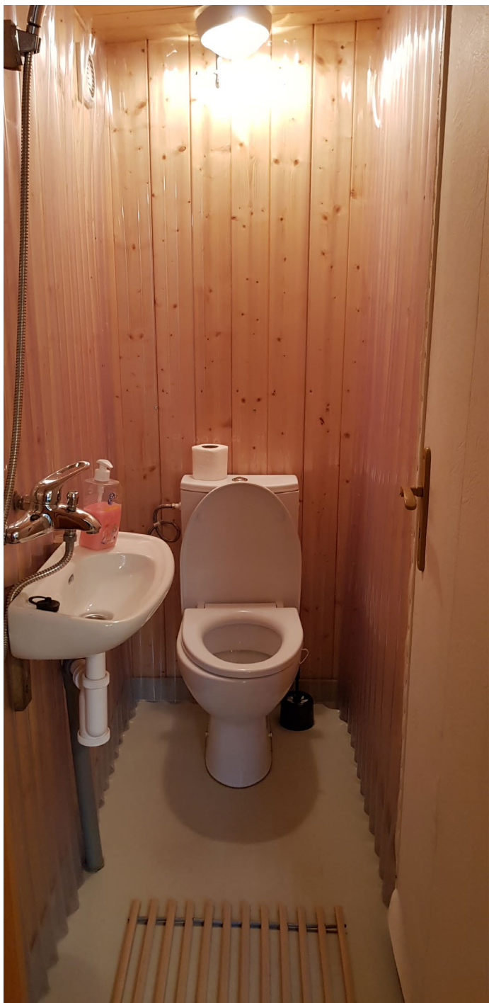
Sprcha a WC ve vedlejší budově