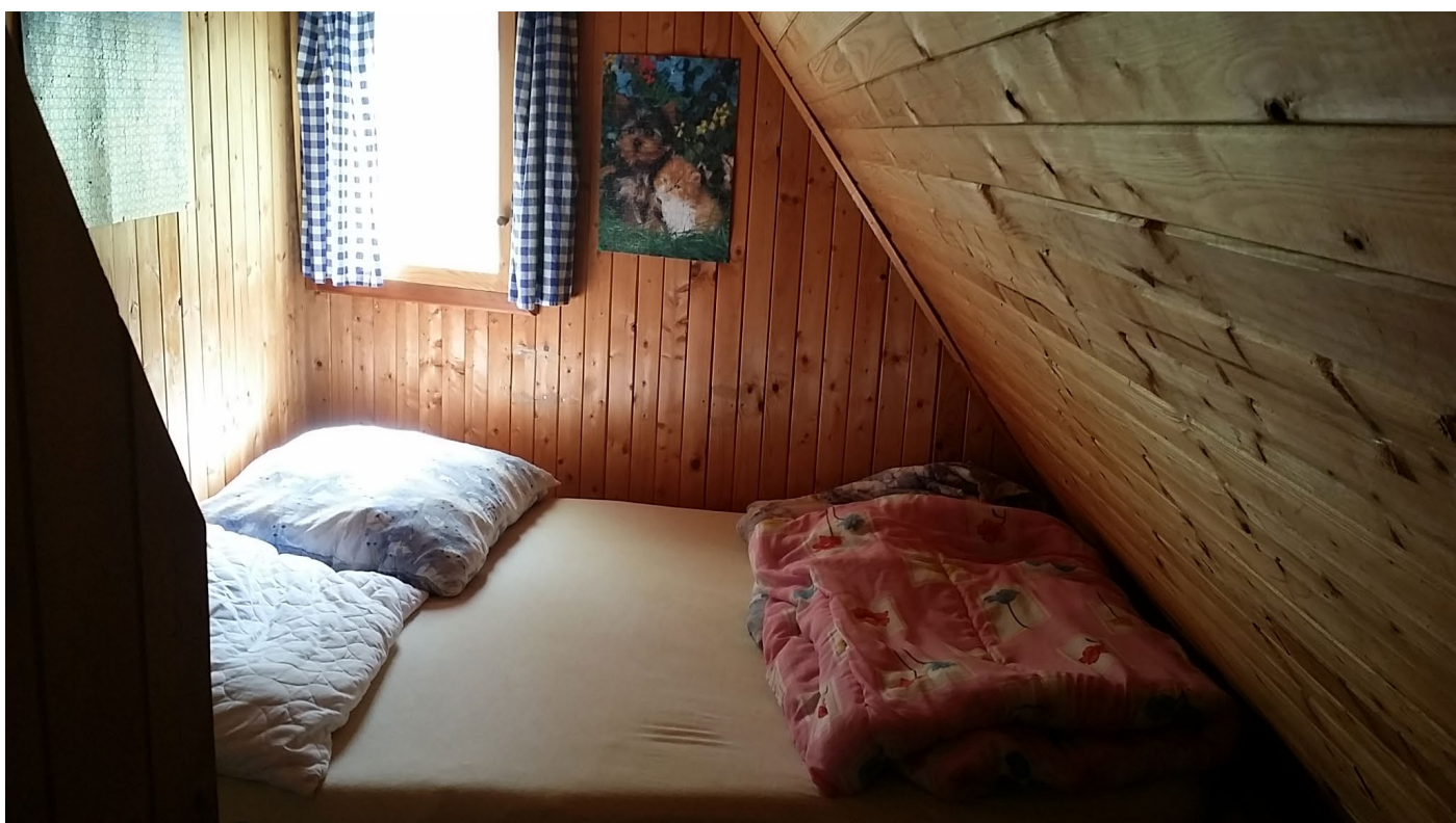
Ložnice se 2 lůžky