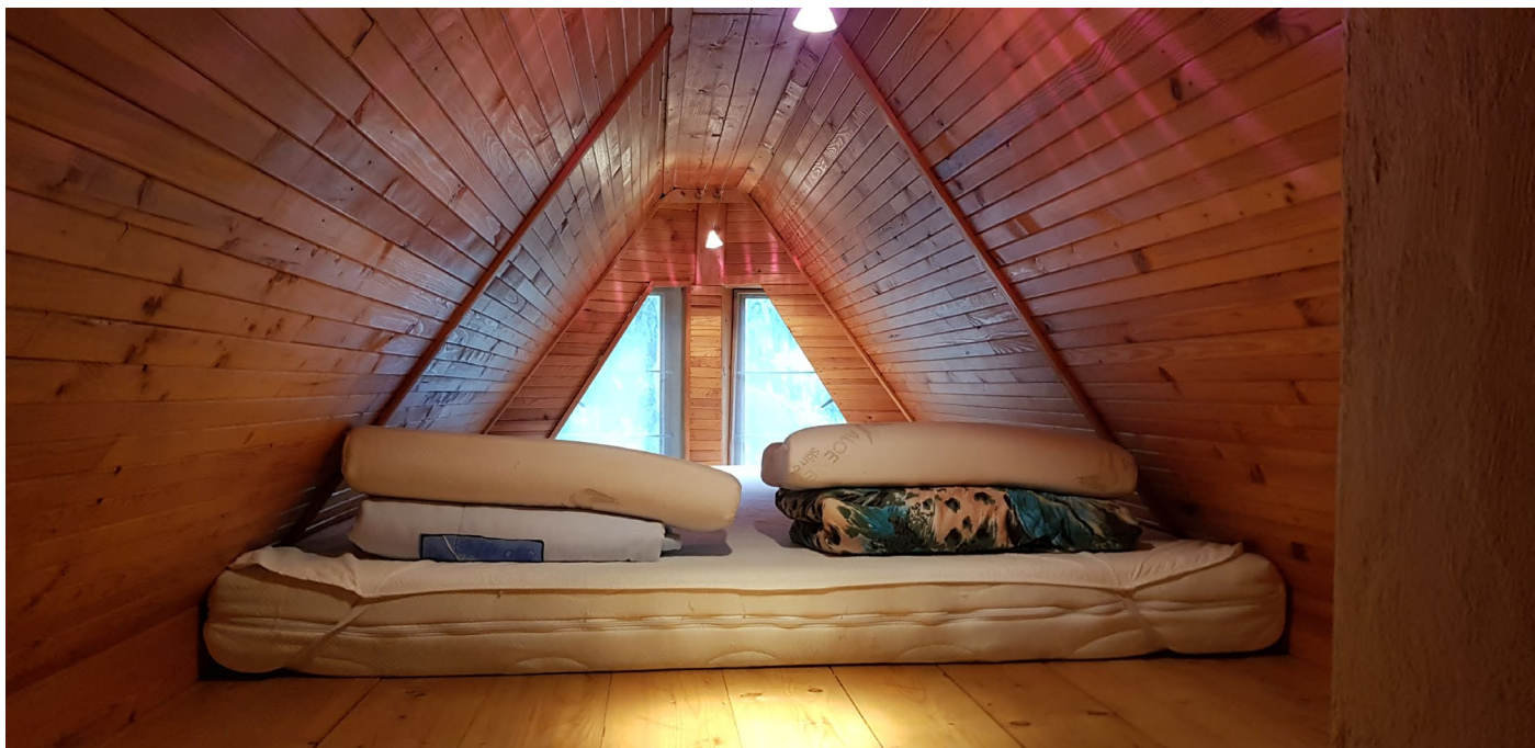
Špička pro 2 osoby nebo 3-4 děti