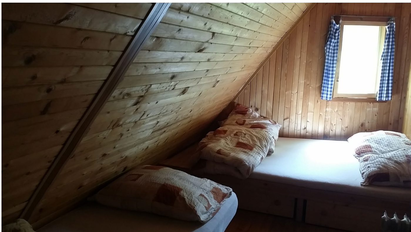
Ložnice se 3 lůžky