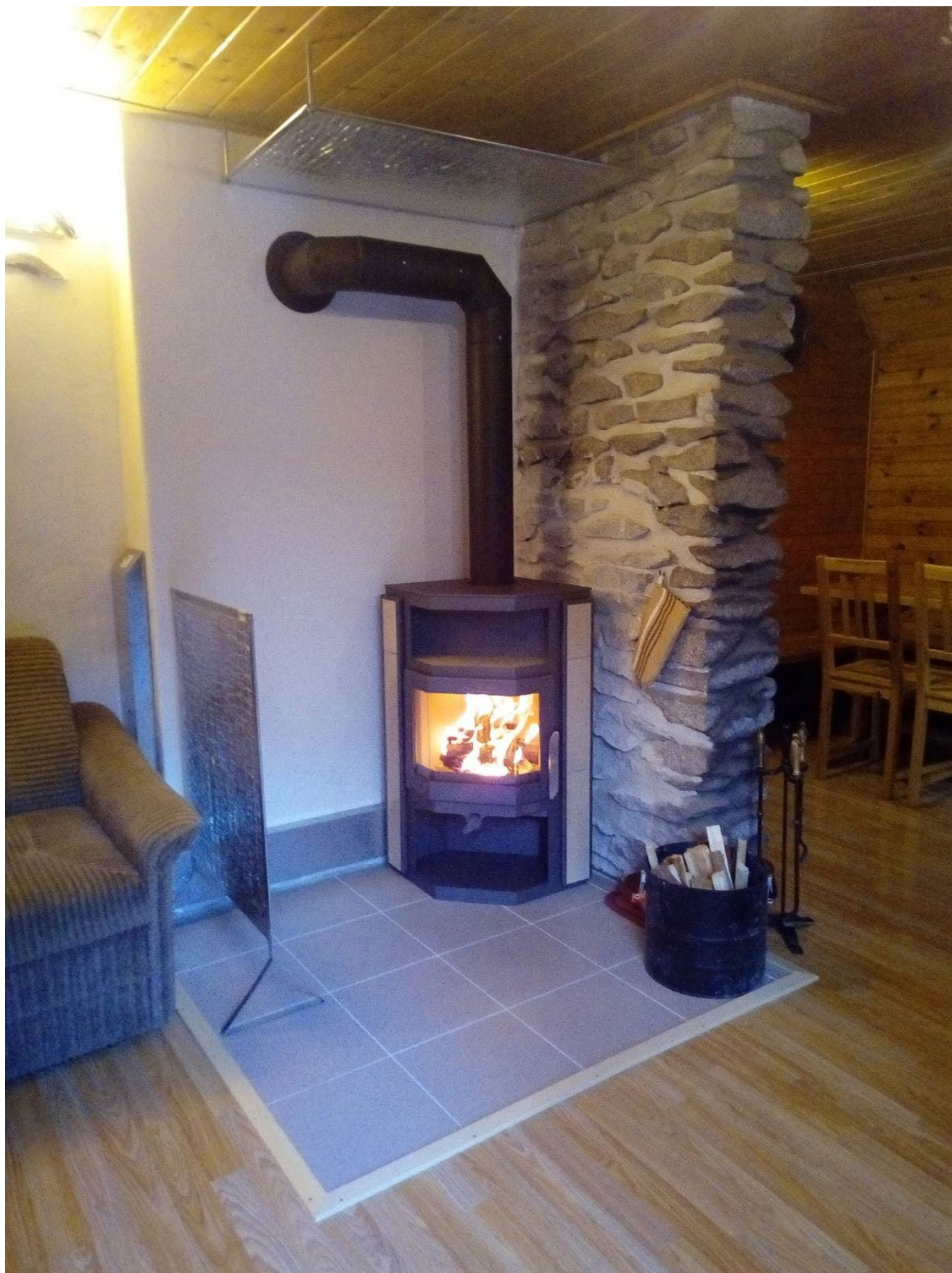
Krbová kamna s vysokou účinností.