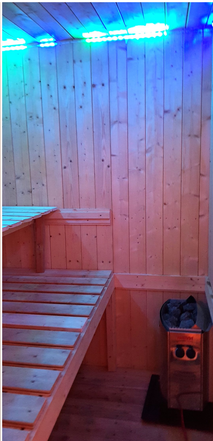
sauna ve vedlejší budově pro 4-6 osob