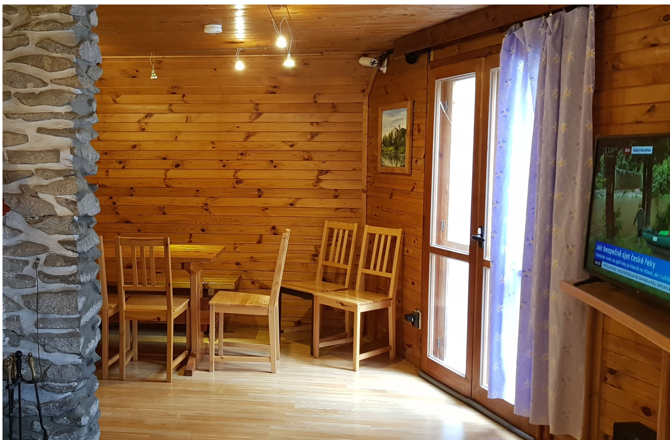
Jídelní kout, pokračuje za rohem. Lavice kolem stolu a židle.